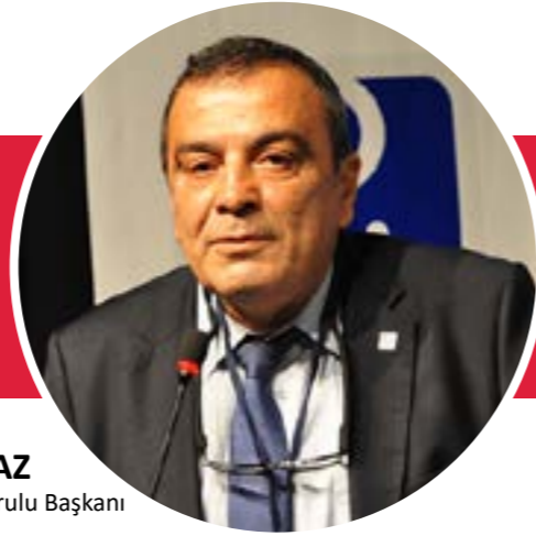
Emin KORAMAZ TMMOB Yönetim Kurulu Başkanı

EMİN KORAMAZ: "Ülkemiz uzunca süredir bizzat iktidar eliyle çok tehlikeli bir kutuplaşmanın içine itilmektedir. Yönetenleri acilen bu anlayışı terk etmeye, seçim sonuçlarını kabullenmeye yurttaşların can güvenliği başta olmak üzere huzurun inşası için adım atmaya çağırıyoruz."