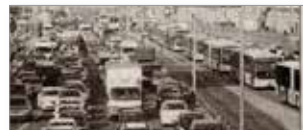
Yurttaşın masasına yapılan zamların doğalgaz, su ve ulaşım geri alındığı belirtildi.