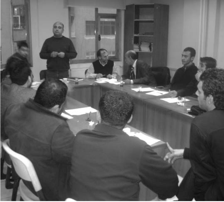
(Şube Seminer Salonu-14.03.2009)