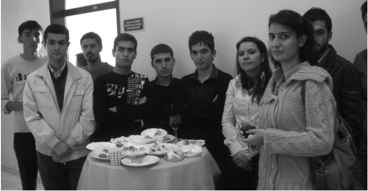
Odamızdaki Teknik Görevli arkadaşlarımızla yeni öğrencilerimiz birbirlerini tanıma fırsatı buldular.